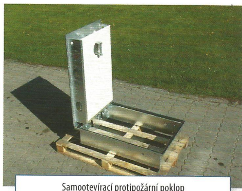
Samootevírací protipožární poklop

Pro více informací nás kontaktovat s vašimi požadavky na protipožární provedení poklopů.