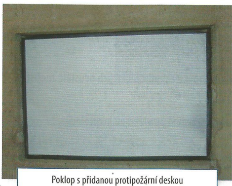
Poklop s přidanou protipožární deskou