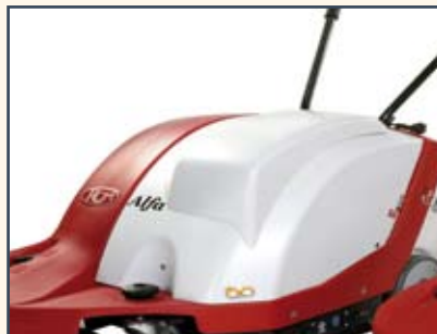
OVERSIZE BONNET GRÖßERE HAUBE RUIME KOFFER