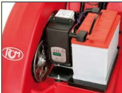
ON-BOARD BATTERY CHARGER INTEGRIERTES BATTERIELADEGERÄT INGEBOUWDE ACCUPLADER