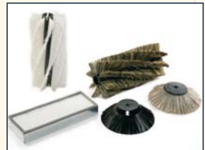
BRUSHES AND FILTERS BÜRSTEN UND FILTER BORSTELS EN FILTERS