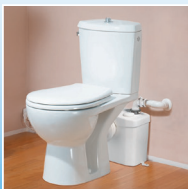
EXTERNÍ PŘEČERPÁVACÍ STANICE