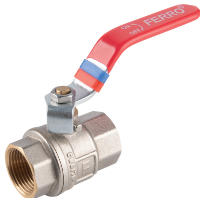
KFP Kulový plnopřůtočný kohout, páka Full-flow ball valve, lever • PN 30, Typ MM • PN 30, Typ FF