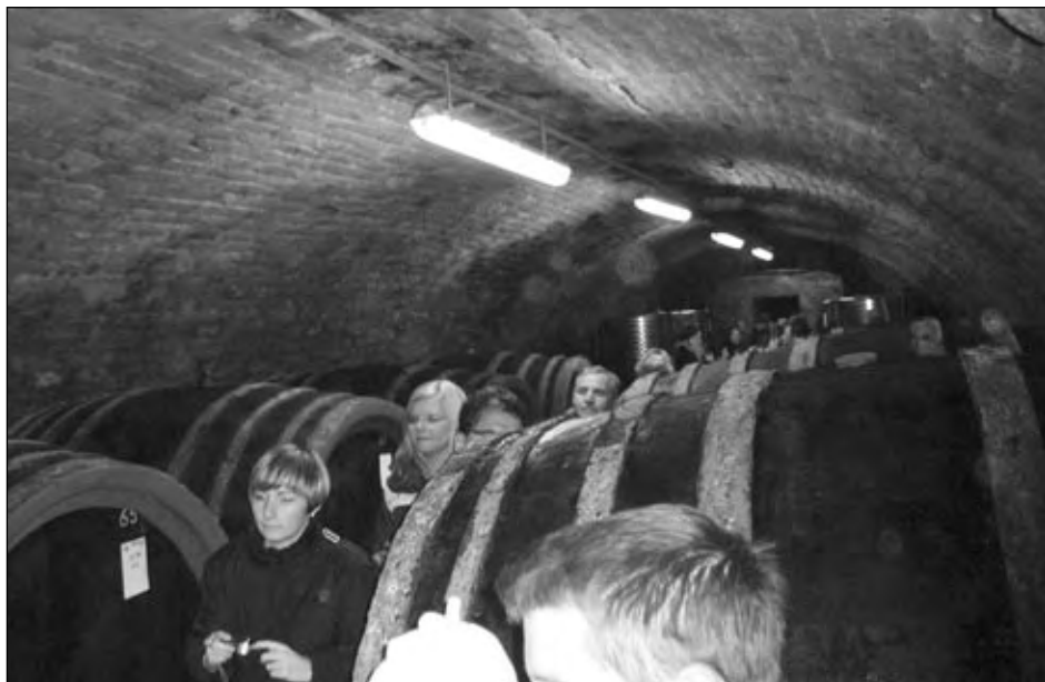
Prohlídka klášterních vinných sklepů v Rajhradě, 23. ledna 2010.