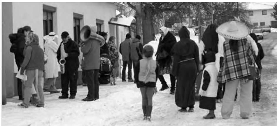
Masopustní veselí – průvod masek obcí, 13. února 2010.