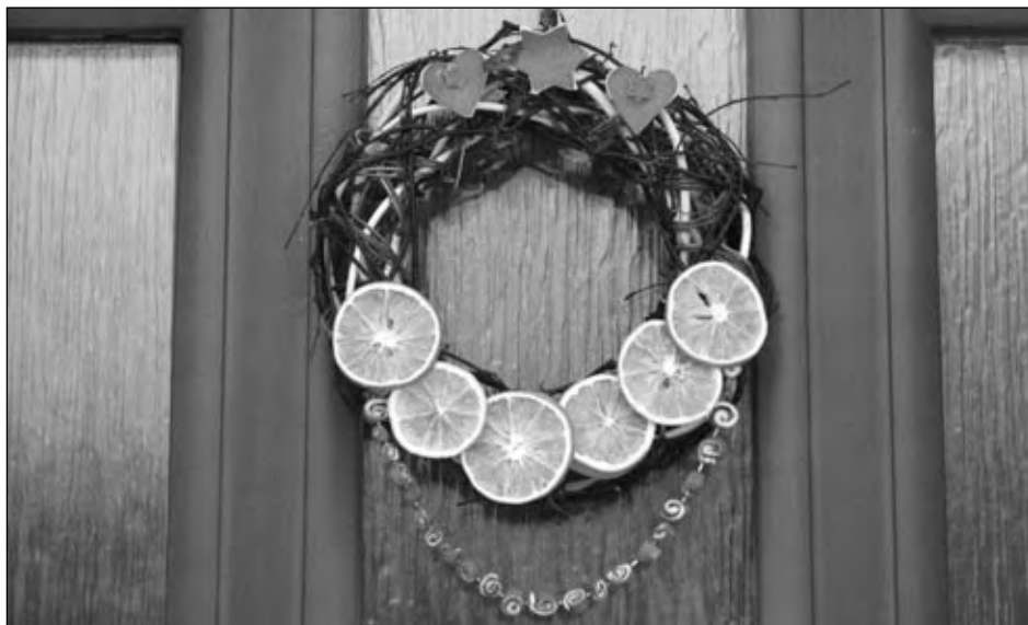
Pomerančový věneček na vstupních dveřích p. Jany Aboulaiche.

obrázky ze sušiny a obecní úřad přidal propagační materiály obce):