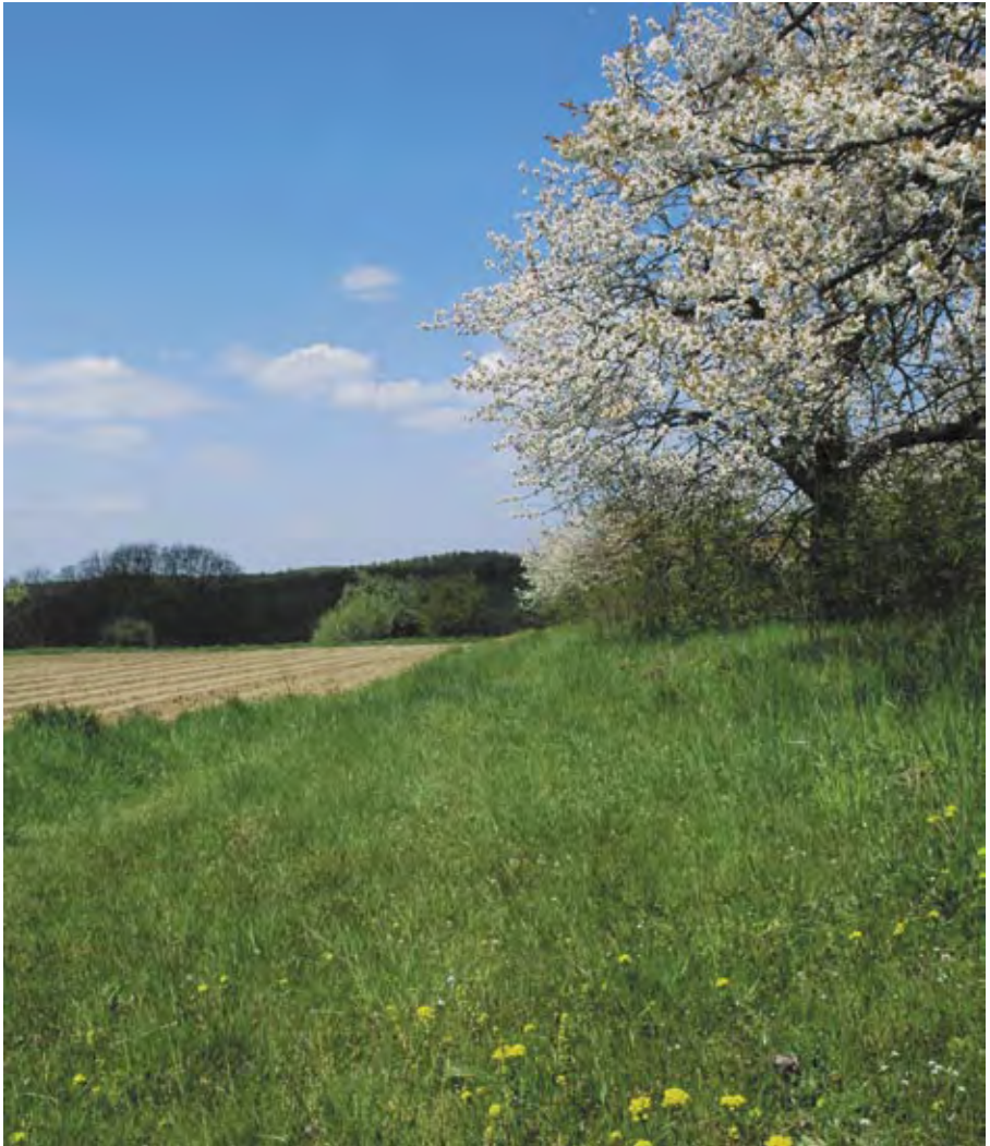
Hlína v květu, duben 2008.