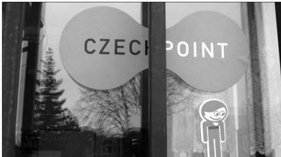
Logo Czech POINT na dveřích obecního úřadu na Hlíně, 8. února 2010.

Obecní úřad Hlína v roce 2009 aktivoval svou datovou schránku. Tímto dnem byl zahájen plnohodnotný provoz datové schránky našeho úřadu. Informační systém datových schránek slouží ke komunikaci s orgány veřejné moci a k odesílání dokumentů od orgánů veřejné moci. Povinně jej musí od 1. listopadu 2009 používat právě orgány veřejné moci ke komunikaci mezi sebou, ke komunikaci s právníky osobami zapsanými v obchodním rejstříku, kterým byla datová schránka zřízena ze zákona, a i ke komunikaci se všemi, kterým byla zřízena datová schránka na základě jejich vlastní žádosti.