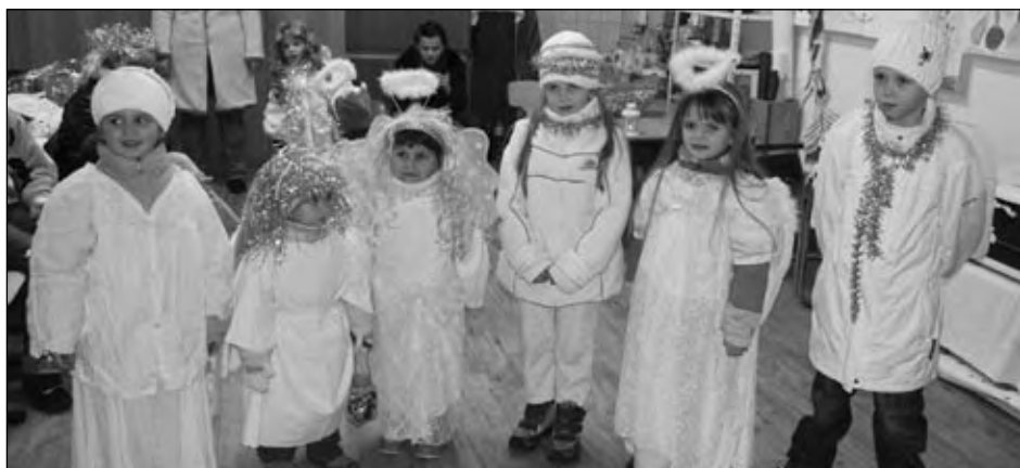
Průvod andělů s nadílkou Mikuláše, 4. prosince 2009.