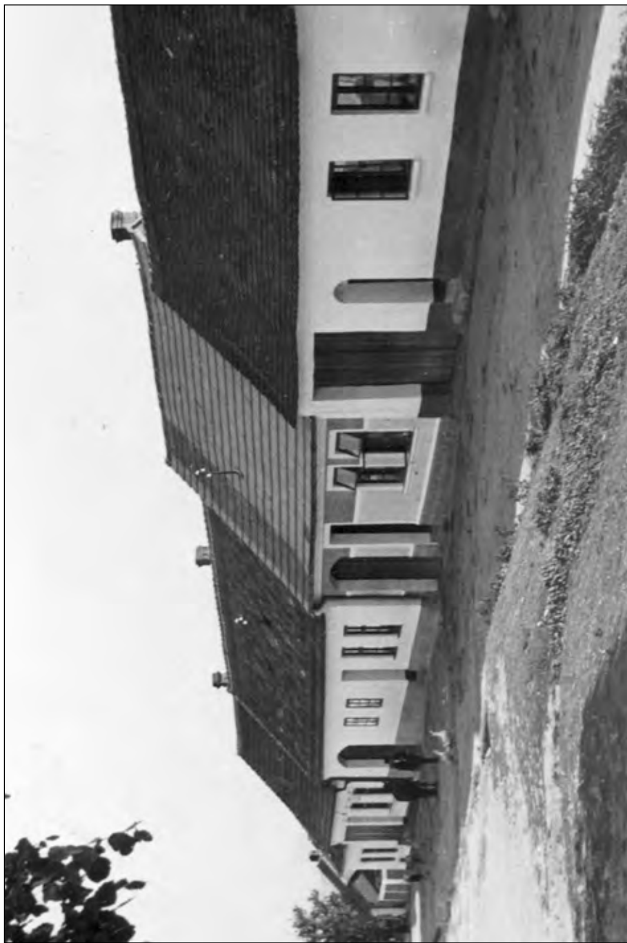
Dolní strana ulice V dědině, 1938; zprava doleva domy č. p. 11, 12, 13 14, 15.