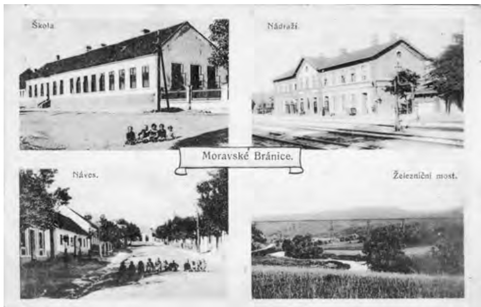
Pohlednice Moravských Bránic, vydal Ondřej Knoll, Náměšť n/Osl., formát 137 × 89 mm, 1920.