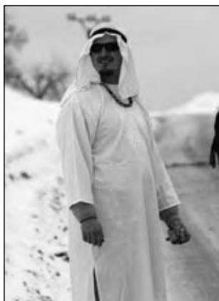
Masopustní veselí – průvod masek obcí, 13. února 2010.