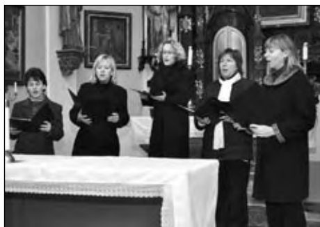
Adventní koncert v kostele sv. Kunhuty na Hlíně, 6. prosince 2009.