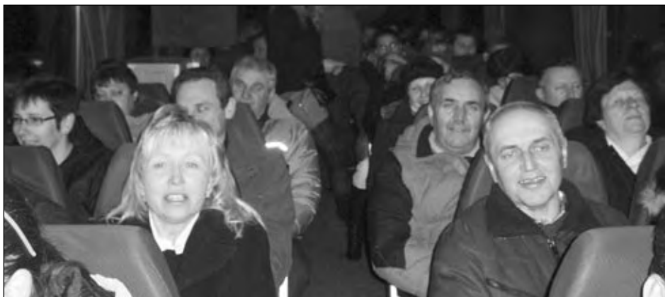
Společné posezení ve vinném sklepě v Horních Věstonicích, 23. ledna 2010.