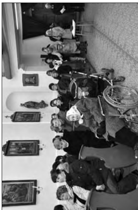
Adventní koncert v kostele sv. Kunhuty na Hlíně, 6. prosince 2009.