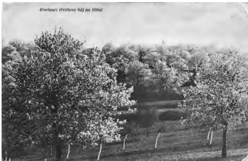
Pohlednice zachycující kvetoucí třešňové sady na Hlíně, vydal Theodor Seka, Ivančice, tisk tiskárna Unie, Praha, formát 138 × 90 mm, kolem roku 1915.