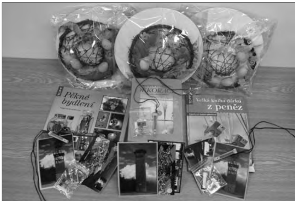
Ceny, které obdržely výherkyně vánoční soutěže, 8. února 2010.