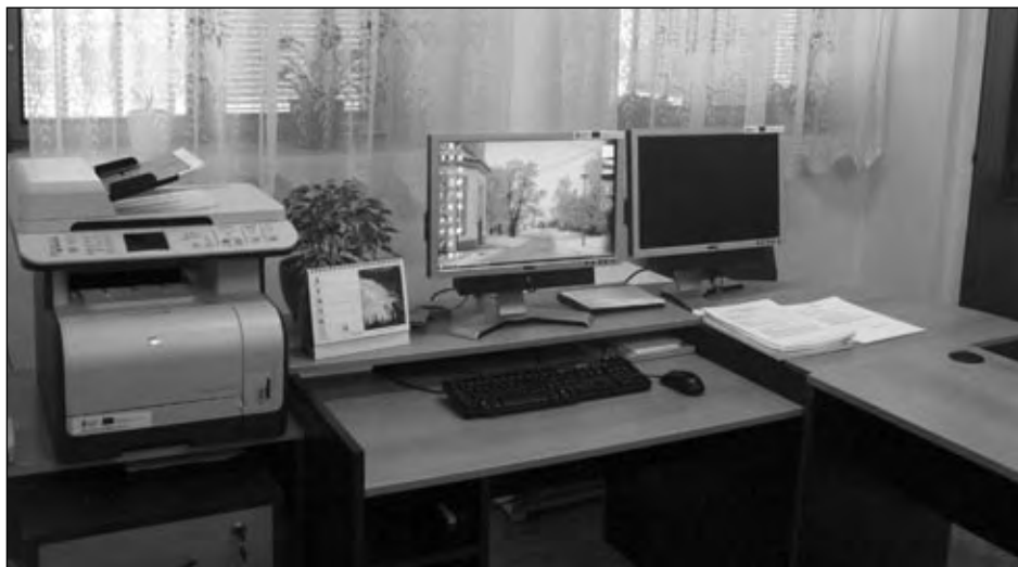
Pracoviště Czech POINT v prostorách obecního úřadu na Hlíně, 8. února 2010.

Vydání první strany výpisu je zpoplatněno částkou 100 Kč, každá další strana výpisu je zpoplatněna částkou 50 Kč.