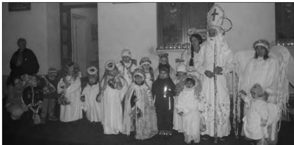
Průvod andělů s nadílkou Mikuláše, 4. prosince 2009.