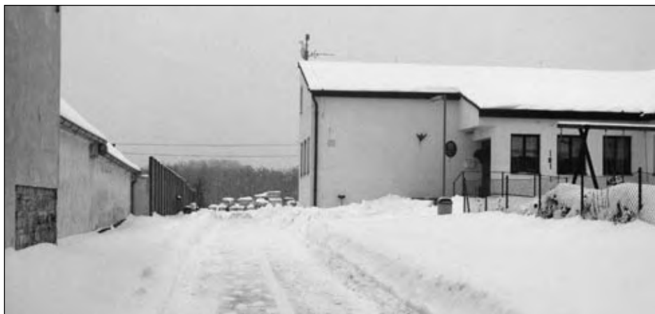
Sněhová nadílka před OÚ na Hlíně, 21. ledna 2010.