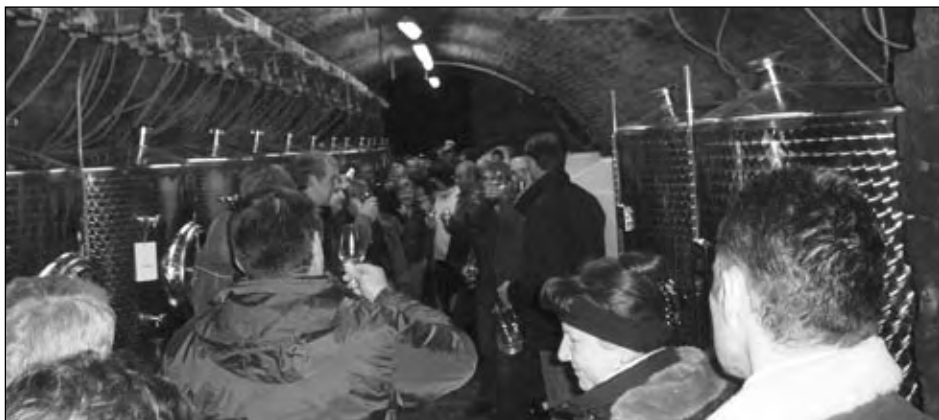
Prohlídka klášterních vinných sklepů v Rajhradě, 23. ledna 2010.